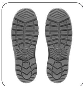
podešev podošva outsole podeszwa